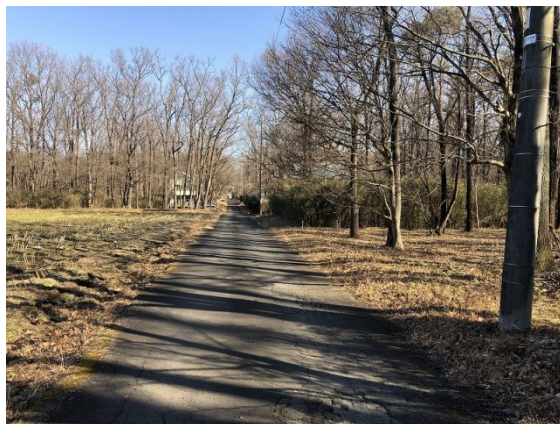
※図面と現況が異なる場合は現況を優先いたします。