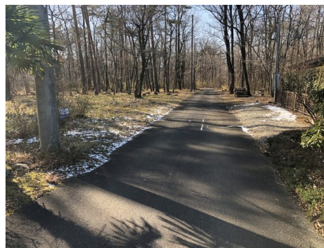
※図面と現況が異なる場合は現況を優先いたします。